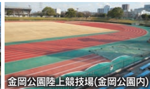
金岡公園陸上競技場(金岡公園内)