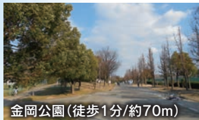
金岡公園(徒歩1分/約70m)

■モデル棟 土地面積/92.00㎡ 1,951.6万円 建物/延施工面積 114.36㎡